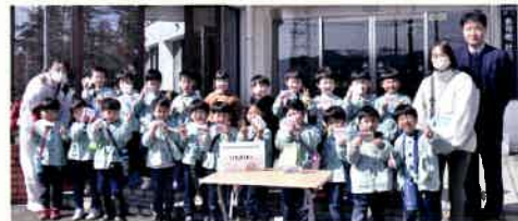
あさかこども園から、義援金を預かりました。作った野菜を販売してお金を集められました。