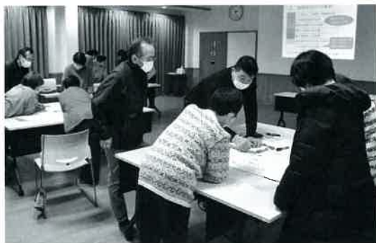
ふくし防災マップの更新(曾我井)