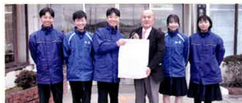
加美中学校生徒会のみなさんから、義援金71,471円を預かりました。

義援金は、中央共同募金会を通じて、被災された方々に配分されます。温かいご支援、本当にありがとうございました。本会各支部の窓口では、引き続き義援金を募集しています。みなさまのご協力よろしくお願いたします。