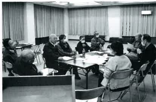
支え合い活動の検討(中三原)