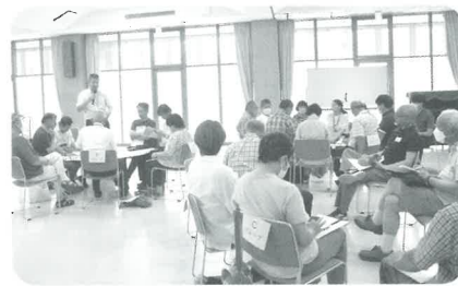
8月3日(土)加美プラザ 参加者 22名

先月号でも紹介したように、本会では7月から8月にかけて区ごとに地域づくり情報交換会を開催しました。様々な方が集まり、集落を超えて「校区でできること」について話し合ったアイデアを紹介します。