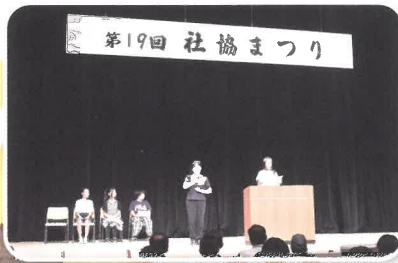
小学4年生の児童による福祉学習体験発表

社協まつりには、みなさまからお寄せいただいた赤い羽根共同募金の配分金を活用させていただきました。