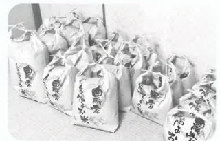
地域のみなさまから寄付いただいた食品