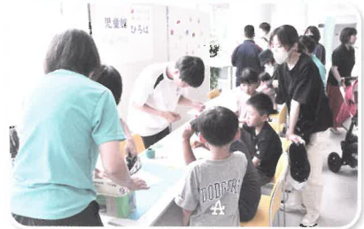
様々なブースでにぎわっていました