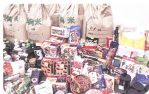
地域のみなさまから