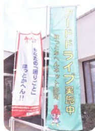
ほっとかへんネット多可も協力