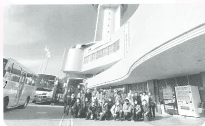
ハートフルツアー